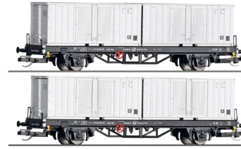
01109 Goederenwagenset van Deutschen Post bestaand uit twee containerwagens Lgklps met belading tp IV,