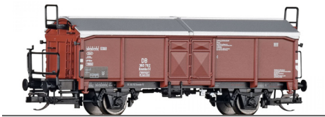
17680 schuifdakwagen Kmmks 51 DB tp III, 17681 schuifdakwagen Tms 851 DB AG tp V en