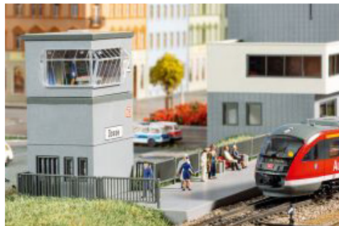
13358 seinhuis Dosse en 43693 inrichting voor bistro. Informatie: https://www.auhagen.de/ .