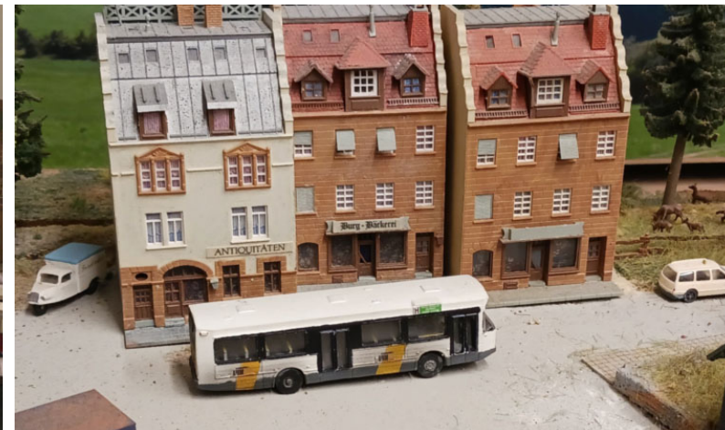
De bus van DE LIJN op Duitse bodem