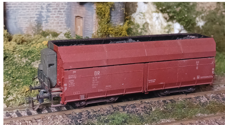
Afbeelding 1. OOt 47 met remmershuis, eerste versie

Nadat ik het eerste exemplaar had geplaatst, kon ik de 3D-tekening verder aanpassen, zodat er minder ruimte hoeft te worden gevuld. Ook moest er meer ruimte komen om de handel van de handrem in de ruimte te laten passen. Bij de eerste plaatsing heb ik van de handel een stukje afgeknipt. Bij de tweede versie was de ruimte groot genoeg, alleen kwam het huis niet in het midden van het bordes te staan. Een optie zou nog zijn om het remmershuis wat breder te maken, maar volgens mij zou dat niet correct zijn. De handel een stukje afknippen is, denk ik, de beste oplossing. Wanneer u geen 3D-ervaring hebt, is het natuurlijk ook mogelijk om het remmershuis uit een ander materiaal maken. Onderstaande afbeeldingen geven de resultaten van het eerste en tweede 3D-model weer. Mochten er leden zijn, die ook een remmershuis willen plaatsen, maar zelf niet de mogelijkheden hebben om dit te maken, dan kan ik kijken of ik ze voor een kleine vergoeding kan laten printen. Moet u ze nog wel zelf schilderen.