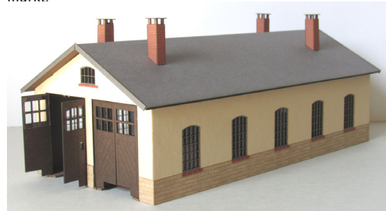
T9401 een tweesporige locloods,

Deze kleinseriefabrikant van lasercut-modellen brengt dit jaar een drietal nieuwe modellen op de markt: