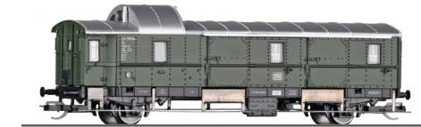
13405 bagagewagen Pwi DB tp III,