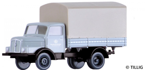
19076 vrachtwagen H3A huif van Metallbaue-nossenschaft Wernigerode. Informatie: https://www.tillig.com/ .