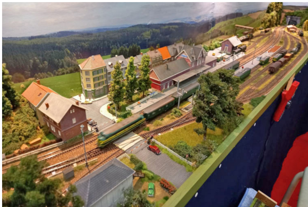
< Station Houyet in TT