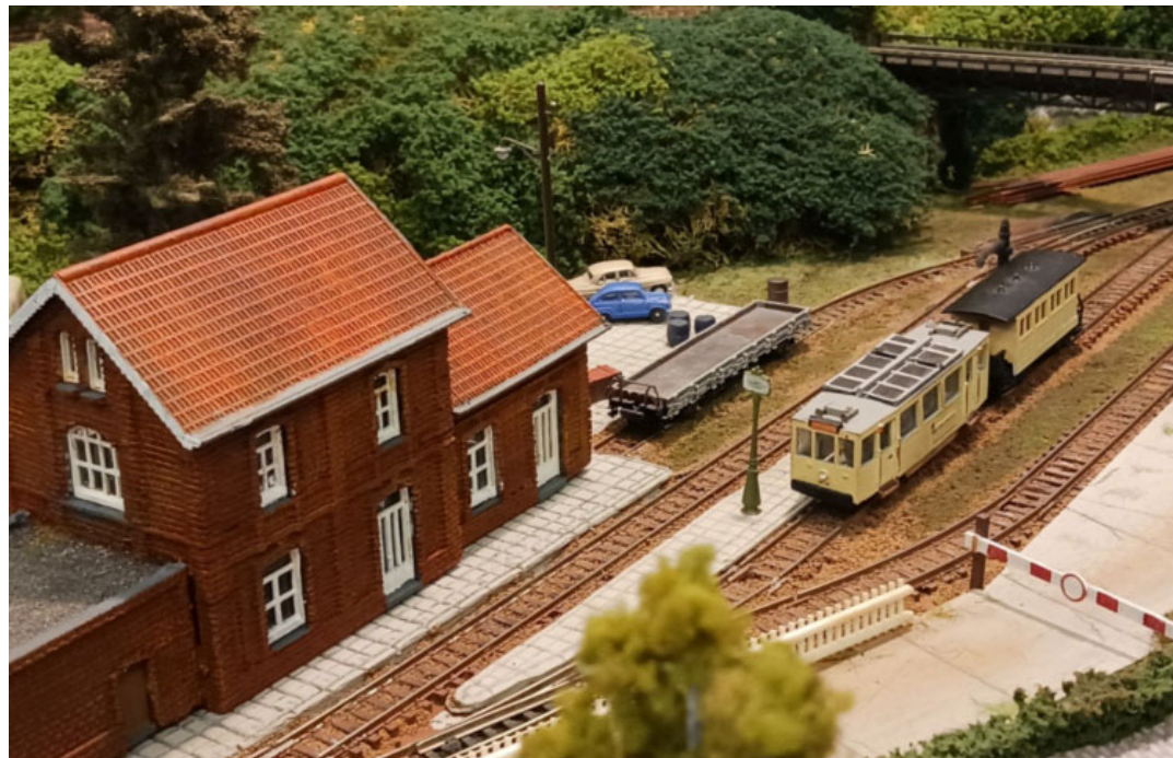
NMVB in TT