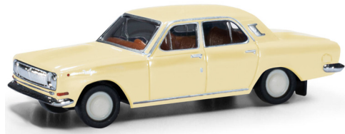
066884-002 Wolga M24 in het parelwit en 066877-002 Moskwitsch 408 in het geel. Informatie: https://www.herpa.de/ .