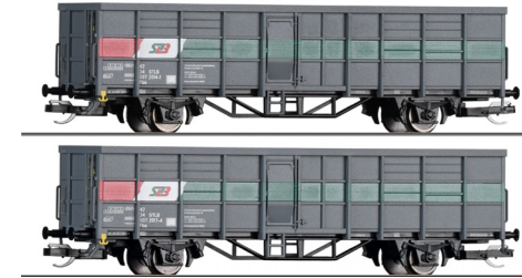
01110 Goederenwagenset van Steiermärkischen Landesbahnen bestaand uit twee open goederwagens Fbs tp V.