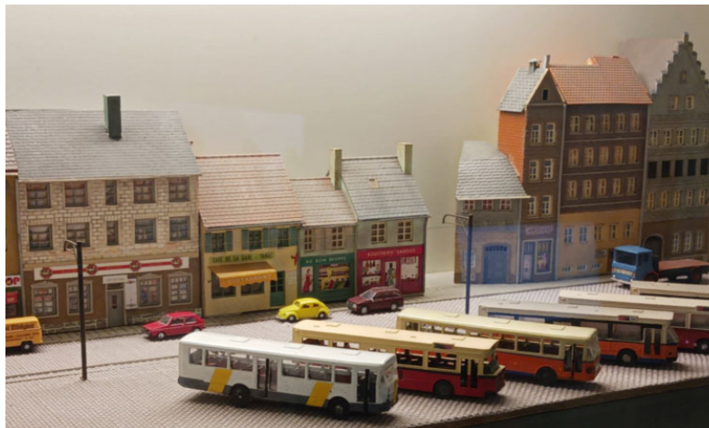
3D geprinte bussen in de schaal TT, verschillende modellen

Ik had het in het begin al over de modellen naar Belgisch voorbeeld. Naast modellen van de bekende merken ook veel zelfbouw. Hiervan waren een groot aantal modellen te bezichtigen. Vooral de bussen van De Lijn in TT zijn een aanwinst. In 3D geprint. Dus, voor mij een uitdaging om eens te kijken of ik dat ook voor elkaar kan krijgen. Er hing wel een prijskaartje aan van 45 euro, maar ik weet uit ervaring hoeveel tijd en energie erin gaat zitten voordat uiteindelijk een acceptabel model wordt geprint.