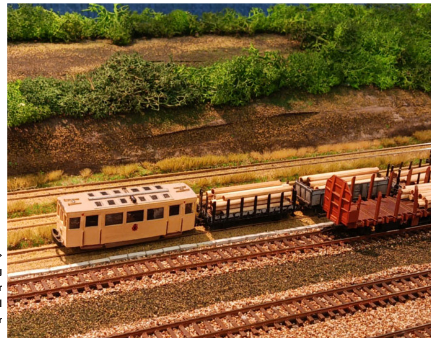
> Houtoverslag van meterspoor naar normaal spoor