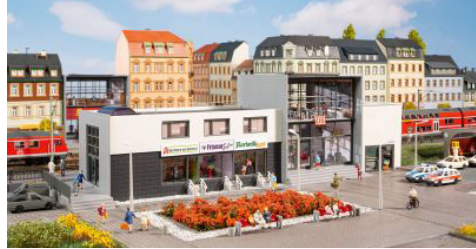
13357 station Dosse,