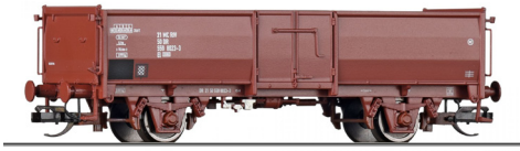
14033 open goederenwagen EI 5598 DR tp IV, 14034 open goederenwagen Omm 52 DB tp III, 14096 open goederenwagen Es 026 DB AG tp V, 14097 open goederenwagen E DSB tp IV,