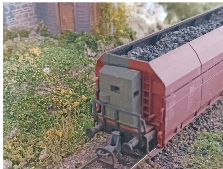
Afbeelding 2. Remmershuis